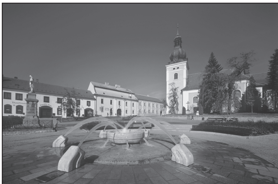
náměstí Krále Jiřího

Vážení spoluobčané, dovolte mi, abych vás pozval 3. července v 15 hodin na slavnostní otevření naší „kunštátské rivieri“. V 16 hodin proběhne tradiční soutěž v beach volejbalu. Bude připraveno bohaté občerstvení ve spolupráci s pivovarem Černá Hora. Letos jsme udělali zásadní posun k plné funkčnosti nádrže. Je to úprava přelivné hrany nádrže a trysek, které slouží k plné funkčnosti čističky. Nové předláždění areálu s výškovými úpravami terénu, nové schůdky a modrý nátěr nádrže. Těmito opatřeními je nádrž plně připravena k budoucímu zafóliování. Pochvala patří všem kunštátským firmám a jejich pracovníkům, včetně zaměstnanců MěÚ, kteří se na rekonstrukci podíleli. Koupání bude po celou sezonu zdarma. Nezbyvá, než si přát hojnou návštěvnost a pěkné počasí.