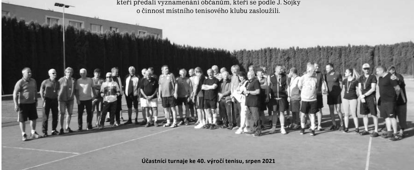
Účastníci turnaje ke 40. výročí tenisu, srpen 2021