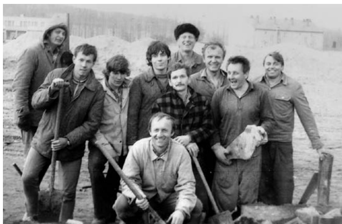
Parta nadšenců při práci

Při této příležitosti jsem byl vyzván, abych se podělil o vzpomínky, jak došlo k výstavbě tenisových kurtů a následnému začlenění kunštátského tenisu do republikového tenisového svazu.