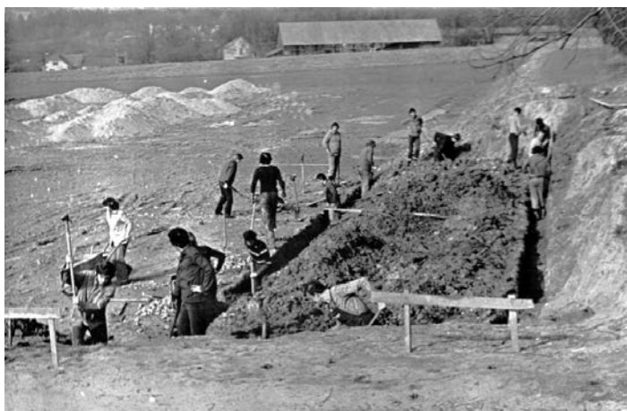
Hloubení základů tenisových kabin