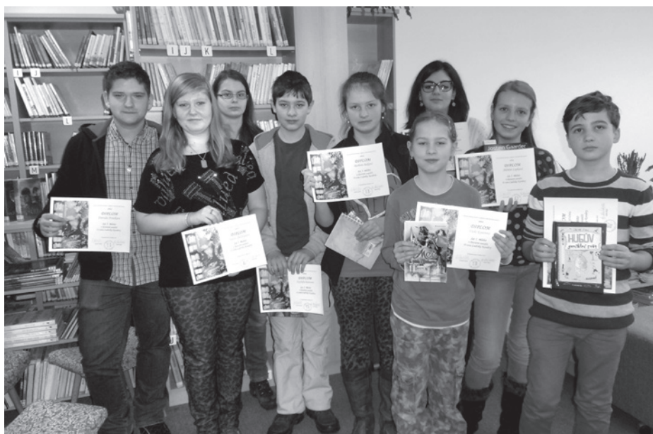
Ocenění účastníci V. ročníku literární soutěže O cenu Ludvíka Kundery.