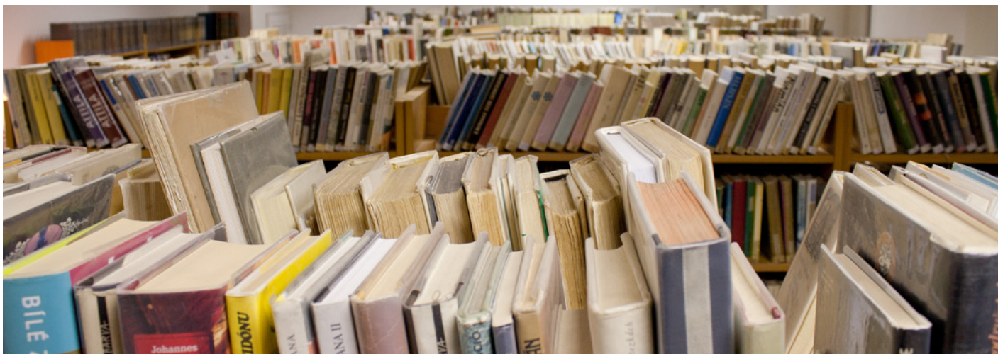
Březen – měsíc čtenářů. Se svými aktivitami se k akci každoročně hlásí víc než 400 aktivních veřejných knihoven z celé ČR.