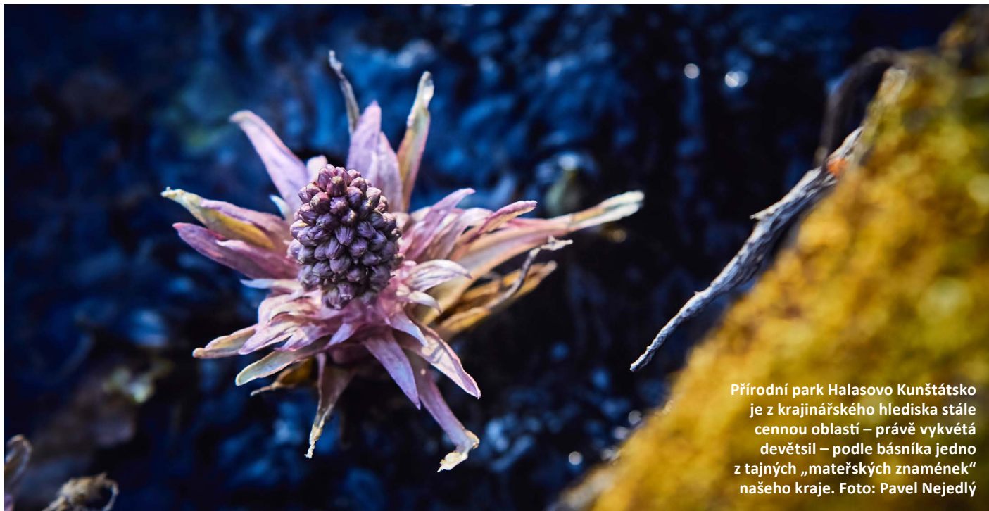
Přírodní park Halasovo Kunštátsko je z krajinářského hlediska stále cennou oblastí – právě vykvétá devětsil – podle básníka jedno z tajných „mateřských znamének“ našeho kraje.