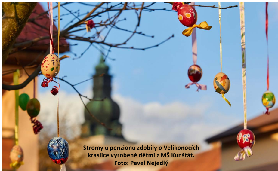
Stromy u penzionu zdobily o Velikonocích kraslice vyrobené dětmi z MŠ Kunštát.