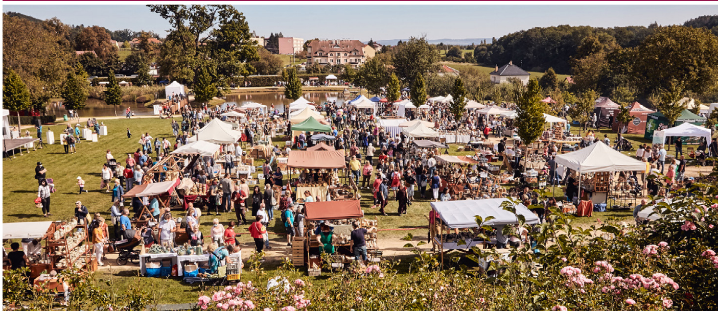
28. hrnčířský jarmark 2020 se do historie zapíše zcela jistě nejen svojí netradiční podobou na neobvyklém místě, ale především nádhernou atmosférou ve sluncem zalitém dni v prostředí Panské zahrady. Děkujeme všem, kteří jste byli s námi, pro nás pořadatele je vaše spokojenost tou nejlepší odměnou. Těšíme se za rok opět na setkání s vámi a keramikou! Organizační akce.