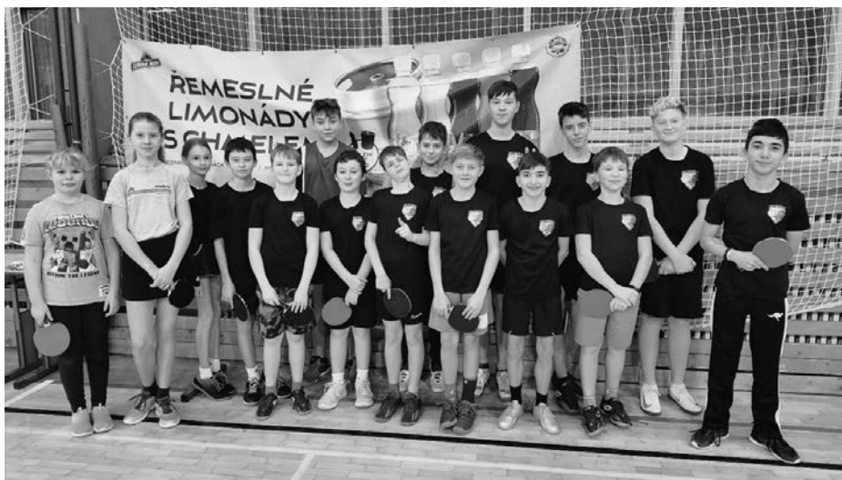
Mládež KST Kunštát

V neděli 26. ledna se konal Okresní bodovací turnaj mládeže. Zúčastnilo se jej celkem 43 hráčů, 16 jich bylo z Kunštátu. Nejlepšího